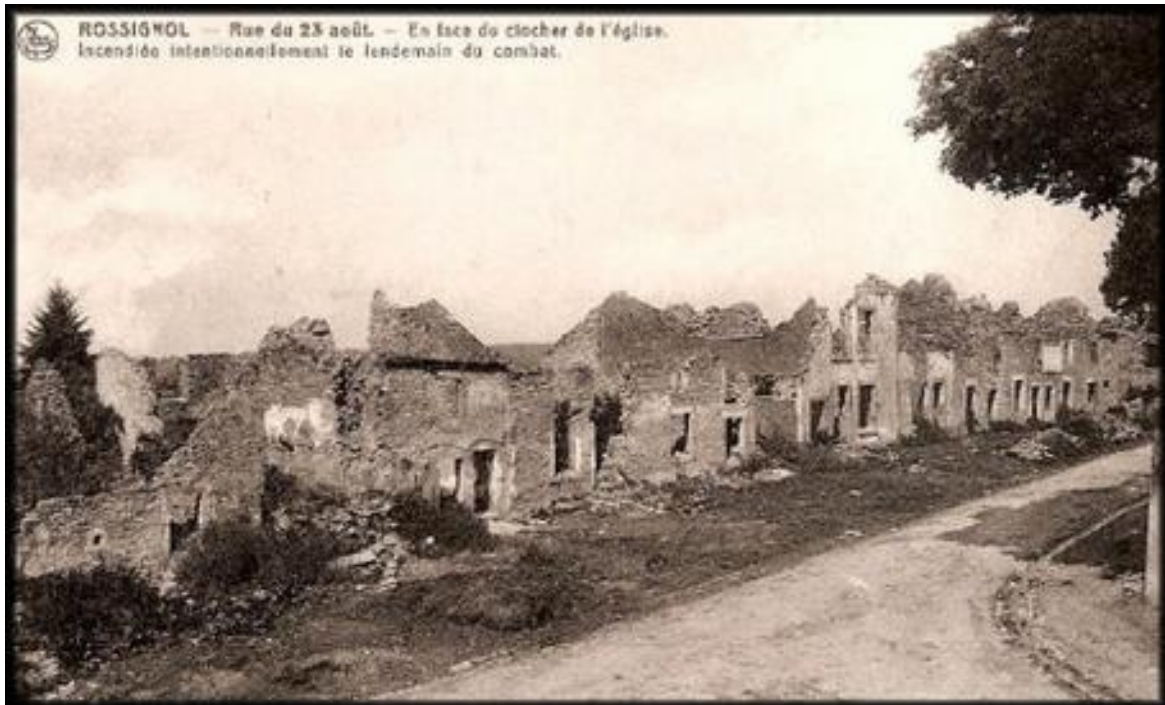
Village de Rossignol à l'issue des combats de 1914 Artois 14-18 (Skyrock.com)

Il quitte Brest le 8 août 1914 par chemin de fer et arrive à Bar-le-Duc le 10. Par étapes successives, il monte vers l' Argonne , passe à Limy et, le 22 août, arrive à Rossignol en Belgique . Le 2 ème R.I.C. est immédiatement plongé dans la bataille de Rossignol . Devant l'ennemi supérieur en nombre, il se bat durement et perdra 2850 hommes ! Les restes du Régiment se regroupent le 23 août à Gérouville , puis amorcent la retraite vers la Marne .