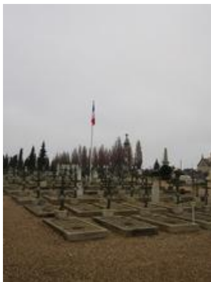
Cimetière de Dreux.