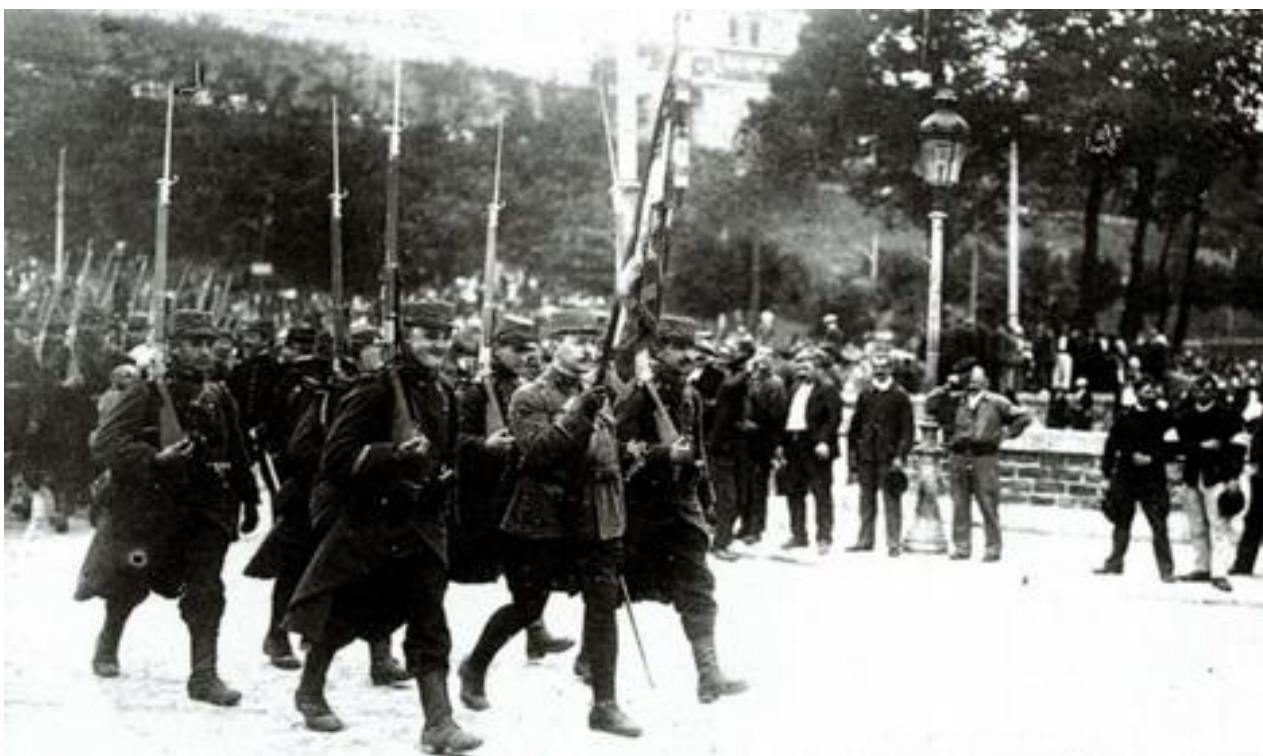
Le 18ème Régiment d'Infanterie à Pau