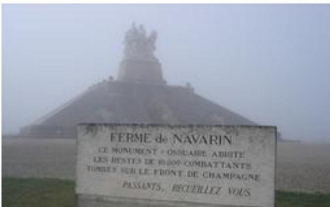
Ossuaire de la Ferme de Navarin