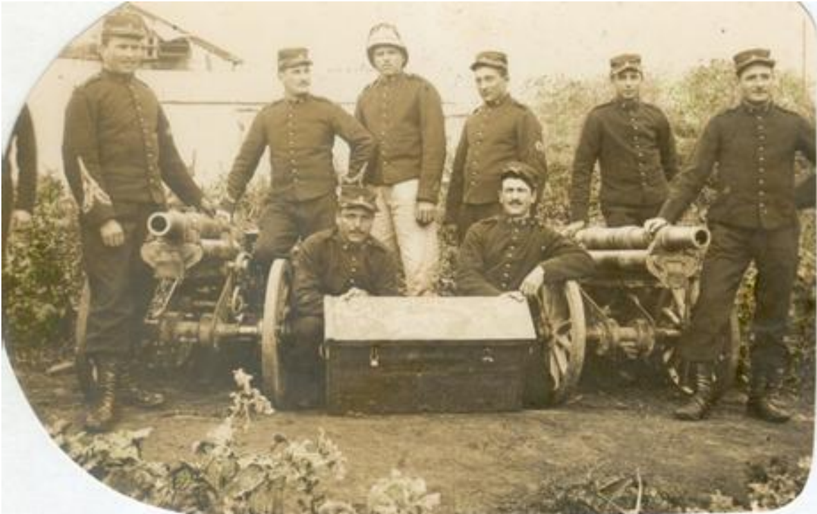
Canonniers au 49 ème R.A.C.