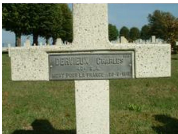
prises le 21 septembre 2017.

En sa mémoire, son nom est gravé sur le monument aux morts d'Ars, son pays natal.