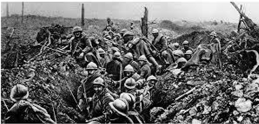
Tranchée devant le Fort de Vaux

Mais il tombe mortellement dans la tranchée de Vaux le 7 mai 1916.