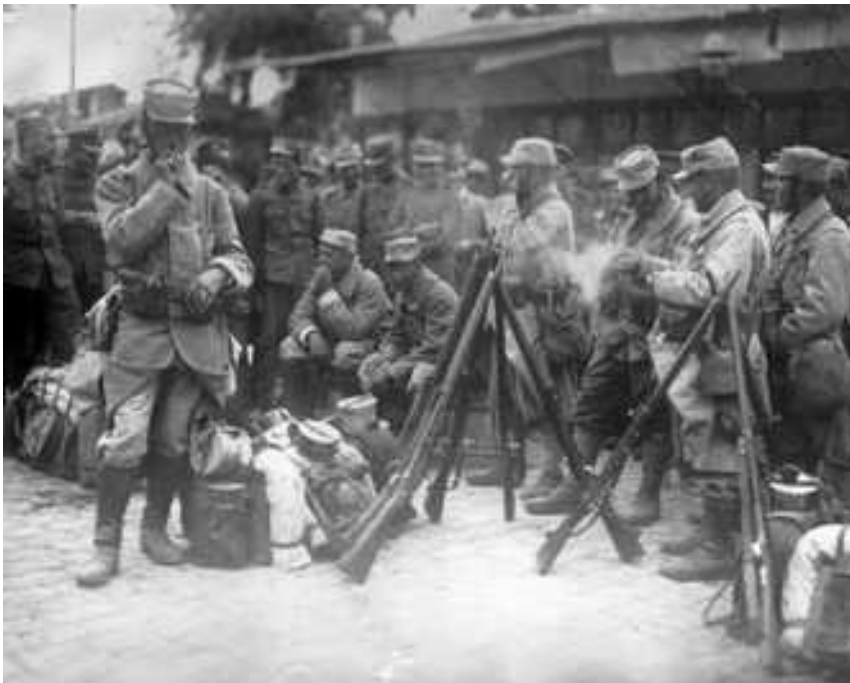
Embarquement pour Monastir (Forum de Brasparts.)