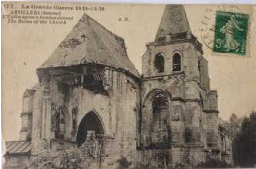
Carte postale; Histoire d'Arvillers

Le 8 août, le 55 ème R.I. lance une offensive en direction de Hailles , les ponts de l' Avre et les bois de Moreuil et Villers-aux-Erables , où il passe la nuit.