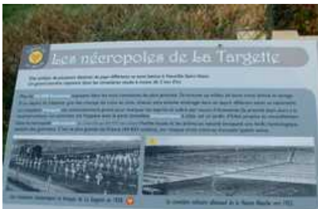
prises le 19 septembre 2017.