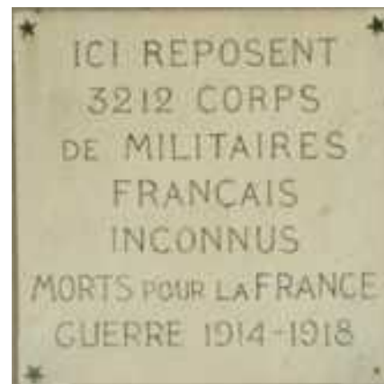
prises le 19 septembre 2017.