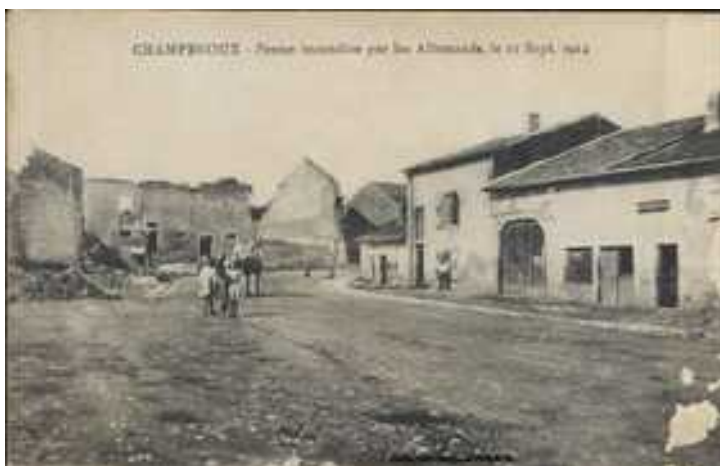
Champenoux fin 1914 ( grandcournne.net )

Le 5 septembre, il occupe les pentes du Pain de Sucre à l'Est d' Agincourt . Le 7 septembre, il explore la forêt de Champenoux . Le 8, le Régiment attaque en direction