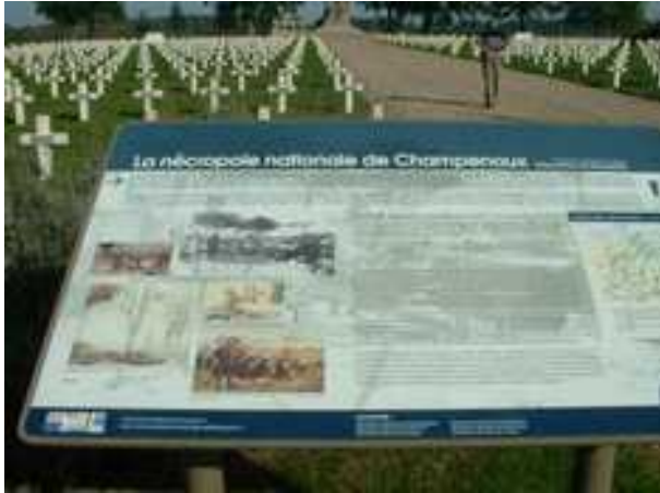
prises le 22 septembre 2017.