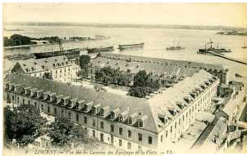
Dépôt de Lorient ( archives.lorient.fr )

Après son passage à l'école, Florentin ne passe pas le Certificat d'Études Primaires.