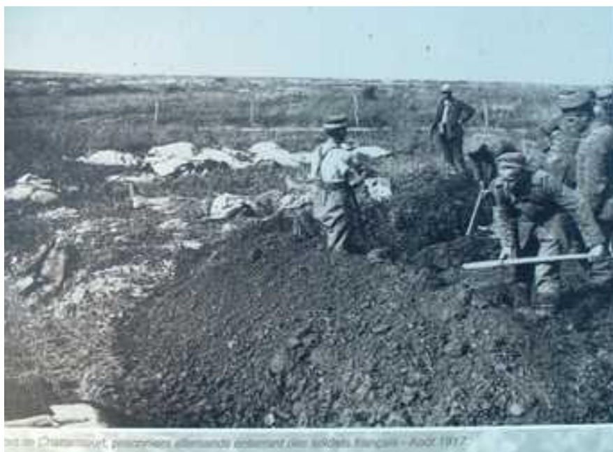
Prisonniers allemands enterrant des soldats français (Archives et Histoire de Chattancourt)

Il repose dans la Nécropole Nationale de Chattancourt dans la Meuse , sépulture n°599, avec 1684 autres soldats.