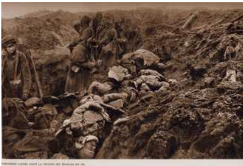
Tranchée de 1ère ligne aux Éparges (Blog de Morvane)

Départ pour la Woëvre , à l'Est de Verdun . Le cantonnement se fait à Bonzée et au Four à Chaux .