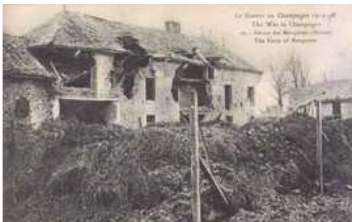
La ferme des Marquises sur le front de la Marne.