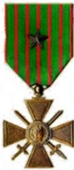
Croix de Guerre avec Etoile de Bronze.

Cité à l'Ordre du Régiment, le 20/13/1918 : « Très bon soldat, très consciencieux. A été particulièrement remarqué par son calme et son courage dans la relève des blessés, au cours des attaques d'octobre 1918. »