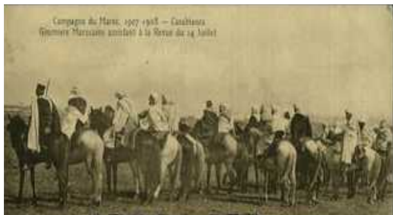
Collection campagne du Maroc 1907-1914