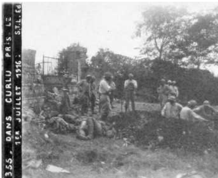
Illustration 1: stereo-guerre-1914-18.curlu.somme