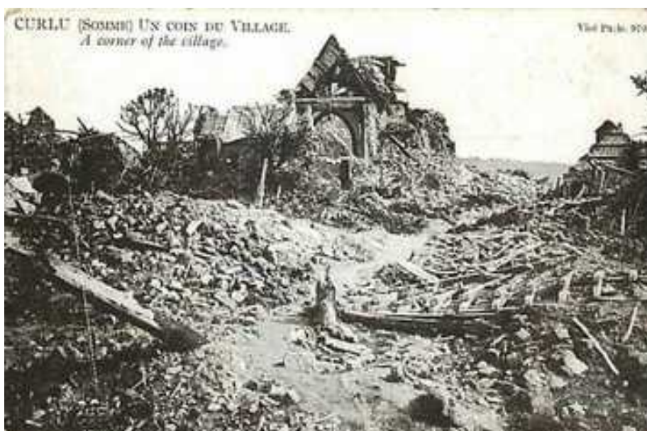
Carte Postale. La Somme 1916