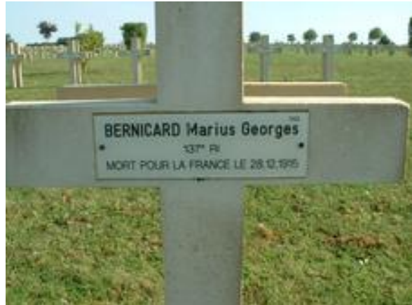
Illustration 1: Photos DH prises le 21 septembre 2017.

Son nom est gravé sur la tombe familiale à Ars.