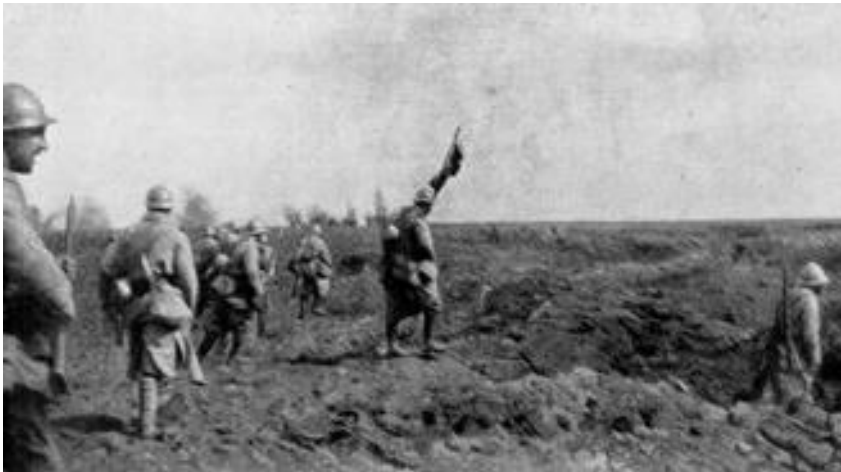
A Somme-Suippes 1915 (Culture, histoire du Patrimoine)

tranchées. Le 27 décembre il repousse vigoureusement des assauts allemands.