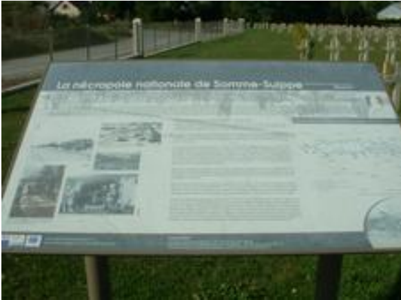
Illustration 2: Photos DH prises le 21 septembre 2017.

Il est enterré dans la Nécropole Nationale de Somme-Suippes, tombe numéro 588 avec 6314 autres soldats.