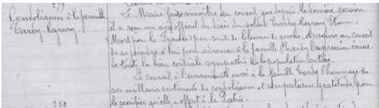
Extrait du compte rendu du Conseil Municipal du 5 juillet 1918