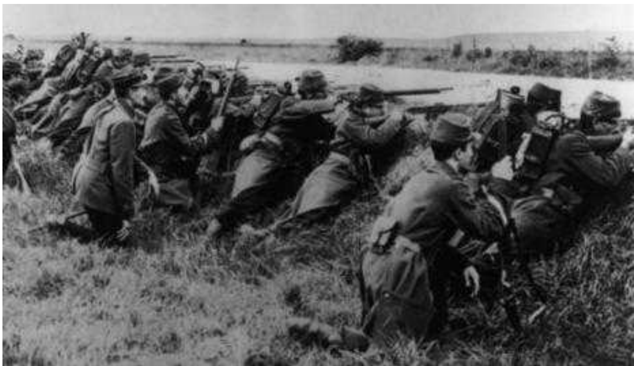
Au bord de l'Yser.

En mars 1917, il participe à l'avance sur Saint-Quentin alors que les allemands reculent sur la ligne Hindenburg .