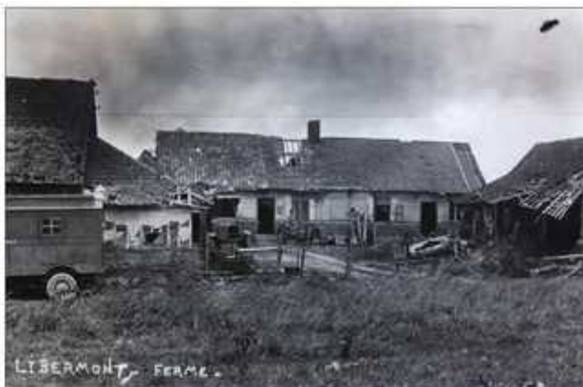
Ferme de l'Hôpital 1918

Le 23 mars, il débarque à Libermont en soutien des Britanniques. Le 24, il occupe le pont de Ramecourt et la Ferme de l'Hôpital .