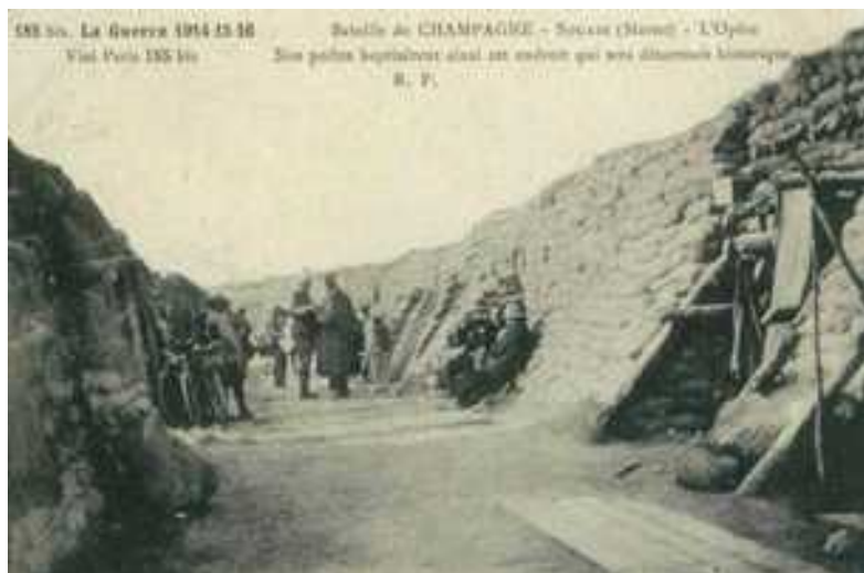
Monuments de Champagne 14-18. L'Opéra

1918 : Du 22 au 29 mars bataille de Noyon dans l'Oise. Du 29 mars au 20 avril Mont-Renaud .