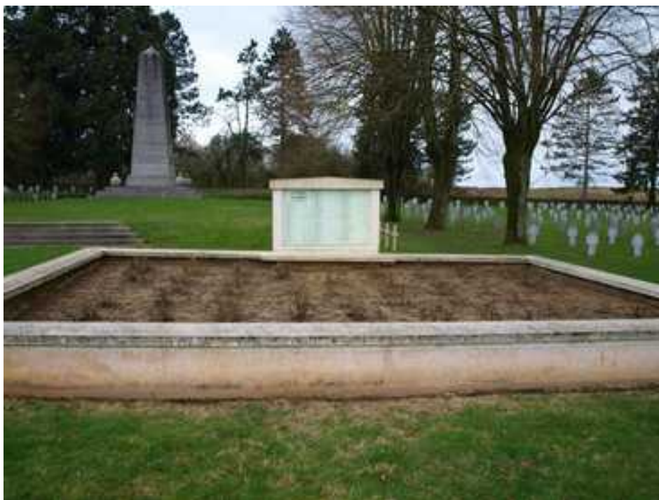
Ossuaire de Guise où repose probablement le corps de Célestin Chauvet. Photo DH sept 2017