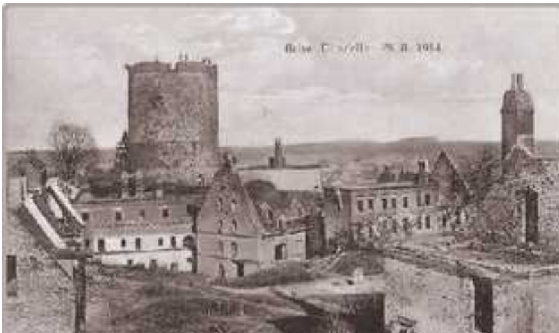
Guise en ruine après le 28 août 1914 Patrimoine Histoire de Guise

C'est le 28 août, à Guise , que le 57 ème R.I., engagé à fond dans cette bataille, montra une ténacité remarquable.