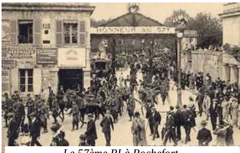
Le 57ème RI à Rochefort.

A la mobilisation générale, il est rappelé le 3 août 1914. Il rejoint Rochefort